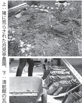
上：猪に荒らされた月見亭農園、下：清航館の瓦

動物や植物の力は凄まじいものがあります。人間と自然がバランスよく暮らしていくためには様々な苦労を乗り越えなければなりません、それも楽しみの一つと捉えていきたいと思います。